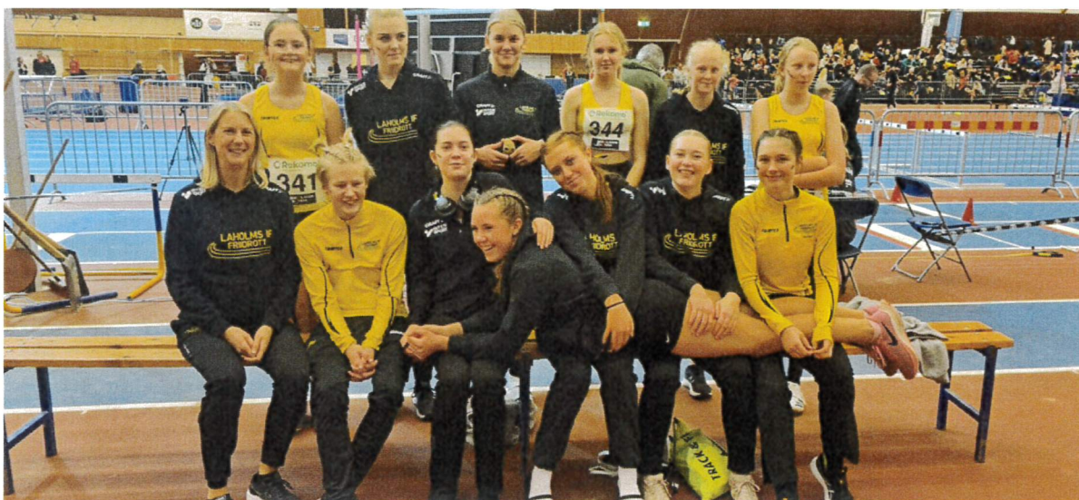
Deltagare från Laholms IF vid Julklappsjakten.