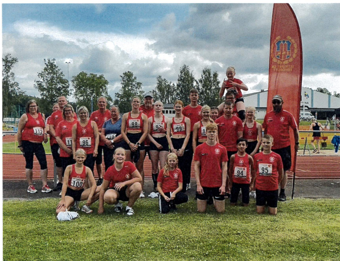
Deltagare från Istrums SK.