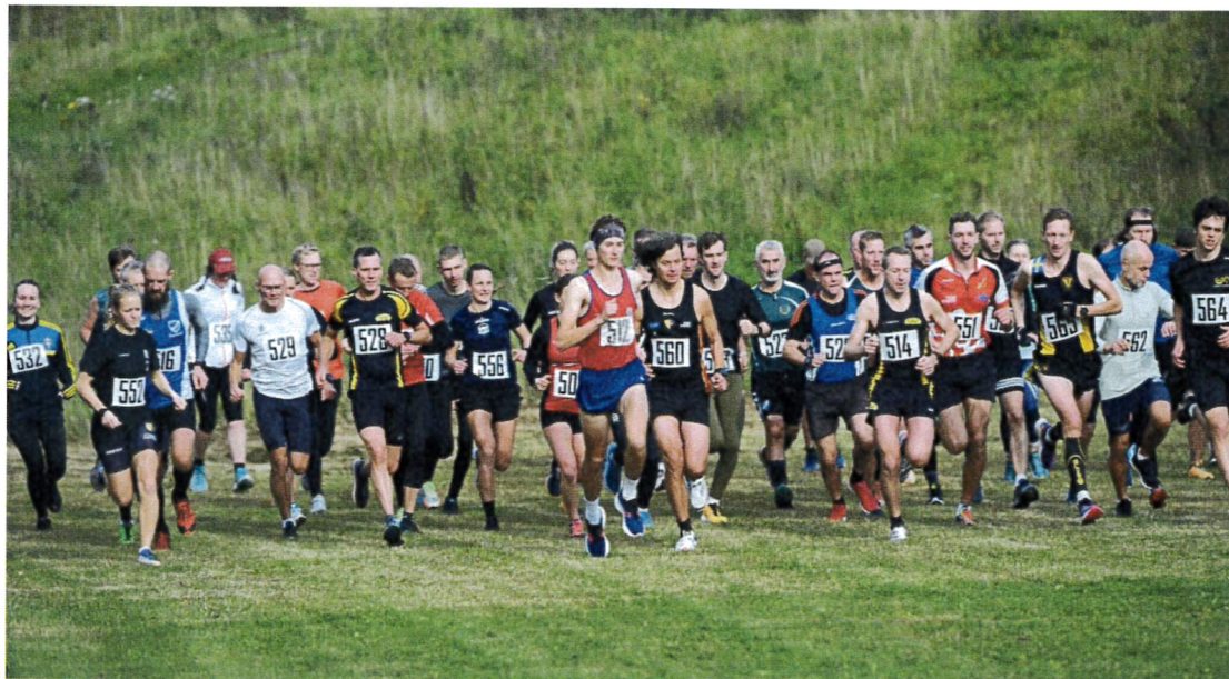
Starten på 10 km vid Mössebergslunken.