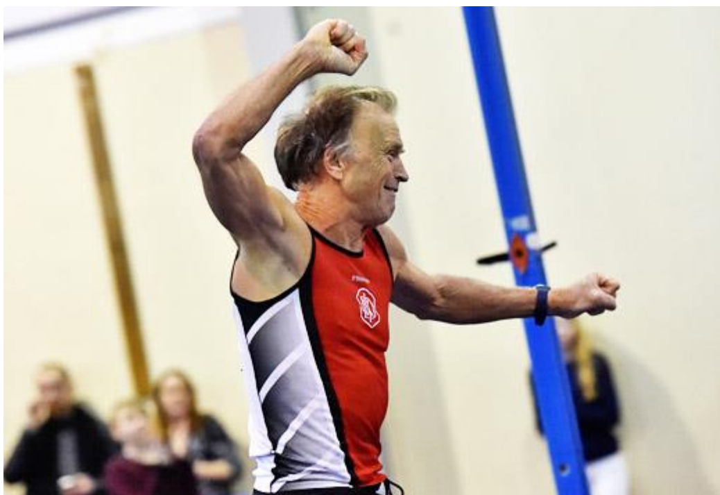
Segerjubil vid VSM inomhus i Borås 45 år senare.

Stavhopp blev verkligen Hasses "sport för livet", så efter elitkarriären fortsatte han att hoppa med samma glädje och entusiasm. Även när hopp höjderna på senare år hade halverats jämfört med elitåren hoppade Hasse fortfarande "på riktigt" med böj på staven. Sista tävlingen gjordes så sent som den 3 mars i vintras då han vann M75-klassen i VSM.