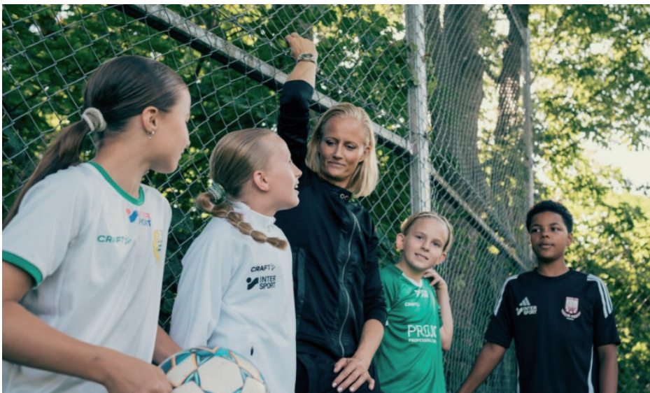
Förra IFK Växjö friidrottaren Carolina Klüft är ambassadör för Eezi.